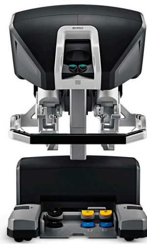
Consola de cirujano