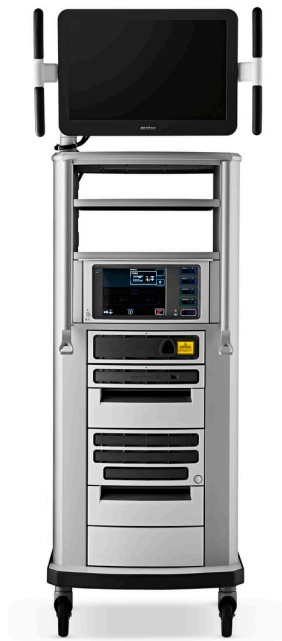
Carro de visión 3D